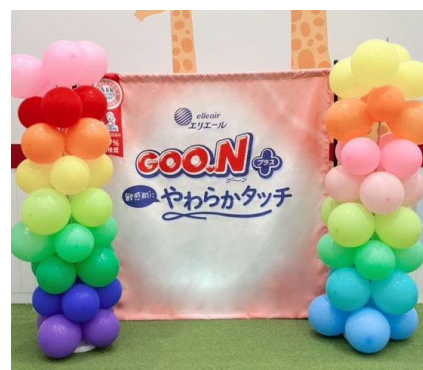
「アカチャンホンポ ららぽーとTOKYO-BAY店」 での親子チエキ撮影会

エリエール商品購入者限定のイベントとして、2025 年 6 月 7 日（土）～8 日（日）に「アカチャンホンポ ららぽーと TOKYO-BAY 店」、6 月 21 日（土）～22 日（日）に「アカチャンホンポ ららぽーと EXPOCITY 店」にて、家族の触れ合いを増やすことを目的とした「親子チエキ撮影会」を開催しました。自分だけの“オリジナルグーン”がつかれる撮影コーナーで家族の思い出を記録し、これまでの家族の絆を振り返ることができる「家族の絆シート」の配布を行いました。