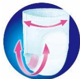
「びったりモレガード構造」イメージ