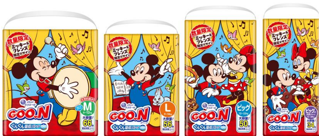
『グーン ぐんぐん吸収パンツ ミッキー＆フレンズ限定デザイン』

衛生用紙製品No.1ブランド※1の「エリエール」を展開する大王製紙株式会社（本社：東京都千代田区）は、ベビー用紙おむつ「グーン ぐんぐん吸収パンツ」から、11月18日の“ミッキー＆ミニーの誕生日”を記念した「ミッキー＆フレンズ限定デザイン」を、2025年11月10日（月）から数量限定で全国発売します。