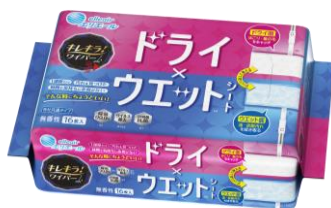
「キレキラ！ワイパー ドライ×ウェットシート」

衛生用紙製品 No.1 ブランド ※1 の「エリエール」を展開する大王製紙株式会社（本社：東京都千代田区）は、住空間の“キレイを気楽に”する拭き掃除ブランド「キレキラ！」から、独自開発の 3 層構造シートを採用し、ドライ面とウェット面の表裏一体化を実現したワイパーシート「キレキラ！ワイパー ドライ×ウェットシート」（2 商品）を 2025 年 10 月 1 日（水）から全国発売します。