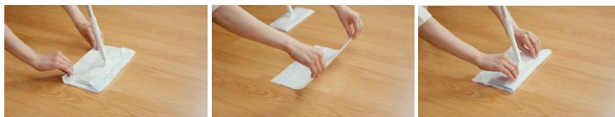
シートを裏返すだけでドライ面とウェット面の交換が可能