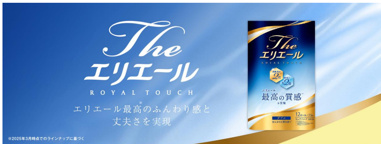
『The エリエール トイレットティッシュ』12 ロール（ダブル）

衛生用紙製品 No.1 ブランド※ 2 の「エリエール」を展開する大王製紙株式会社（本社：東京都千代田区）は、エリエールブランド最高品質※ 1 のトイレットペーパー『The エリエール トイレットティッシュ』のパッケージデザインを刷新するとともに、より長くフレッシュな状態で上質なフローラルソープの香りをお楽しみいただけるようにグレードアップして、2025 年 8 月 20 日（水）から全国発売します。