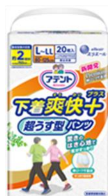
アテント 超うす型パンツ 下着爽快プラス L～LL 男女共用 20枚