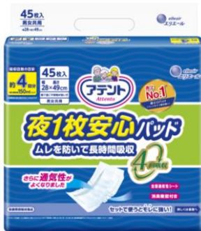
アテント 夜 1 枚安心パッド ムレを防いで長時間吸収 4 回吸収 45 枚

エリエールブランドの大王製紙株式会社(住所:東京都千代田区富士見二丁目 10 番 2 号)は、夜用パッドに求められる基本機能の「モレにくさ」に「肌のやさしさ」をプラスした『アテント夜 1 枚安心パッド』を平成 28 年 9 月 21 日よりリニューアルします。