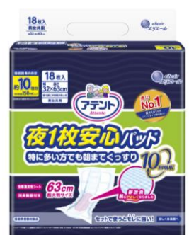
アテント 夜 1 枚安心パッド 特に多い方でも朝までぐっすり 10 回吸収 18 枚

※イメージ SRI 調べ大人用おむつ尿とりパッド (パンツ用パッドを除く) 市場 2015 年 4 月~2016 年 3 月 累計販売金額 NO.1 ブランド (アテント夜用パッドシリーズ 合計)