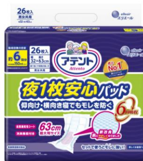
アテント 夜 1 枚安心パッド 仰向け・横向き寝でもモレを防ぐ 6 回吸収 26 枚