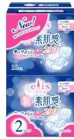
エリス新・素肌感 多い日の夜用 羽つき