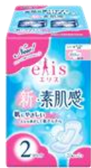
エリス新・素肌感 ふつう~多い日の昼用 羽つき