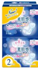
エリス新・素肌感 多い日の夜用 羽なし