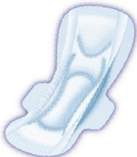
※製品イメージ図(29cm 羽つき)