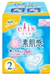
エリス新・素肌感 ふつう~多い日の昼用 羽なし

エリエールブランドの大王製紙株式会社(住所:東京都千代田区富士見二丁目10番2号)は、ムレが気になる生理中の肌にやさしい生理用ナプキン『elis(エリス)新・素肌感』を、2016年3月1日よりパッケージリニューアル(全商品)、品質の改善リニューアル(夜用商品)、入枚数の変更(昼用羽なし)を行い、発売します。