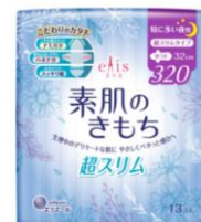
特に多い夜用 超スリム 羽つき 32cm (リニューアル)

このたび「素肌のきもち」の全面リニューアルを機に、商品特長である独自形状にキャッチーなネーミングを採用します。長めの羽※1で重ね止めしやすい「ハネナガ」、ナプキンの余分な四隅をカットすることでこすれにくい仕様の「ナミガタ」、そして、独自の幅設計でよれにくい「スッキリ幅」のこだわりのカタチで、ナプキン形状による新しい価値を生活者に提案してまいります。