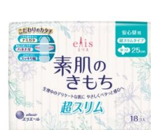
安心昼用 超スリム 羽つき 25cm (新発売)