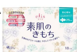
安心昼用 羽つき 25cm (新発売)