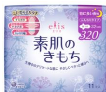
特に多い夜用 羽つき 32cm (リニューアル)