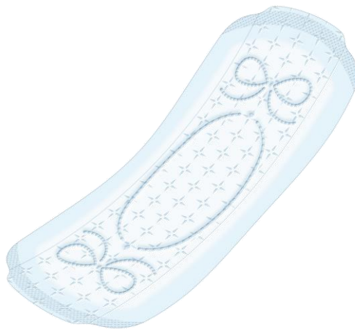
※20.5cm羽なしイメージ図