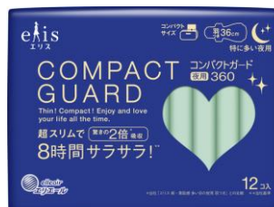
特に多い夜用 羽つき 36 cm