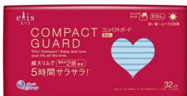
多い昼～ふつうの日用 羽なし 20.5 cm