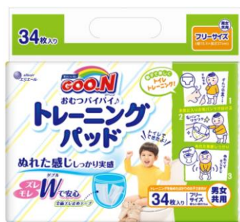
GOO.N おむつバイバイ♪ トレーニングパッド

本年ブランド誕生 40 周年を迎えたエリエールブランドの大王製紙株式会社(住所：東京都千代田区)は、「グ〜ン おむつバイバイ♪トレーニングパッド」を 2019 年 11 月 1 日(金)より全国でリニューアル発売します。