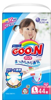
GOO.N パンツ まっさらさら通気 Lサイズ 女の子用