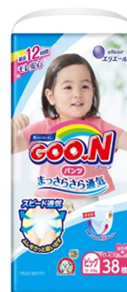
GOO.N パンツ まっさらさら通気 BIGサイズ 女の子用