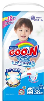
GOO.N パンツ まっさらさら通気 BIGサイズ 男の子用