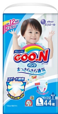
GOO.N パンツ まっさらさら通気 Lサイズ 男の子用

本年ブランド誕生 40 周年を迎えたエリエールブランドの大王製紙株式会社(住所：東京都千代田区)は、「グ〜ン パンツ まっさらさら通気」を 2019 年 9 月中旬より全国でリニューアル発売します。