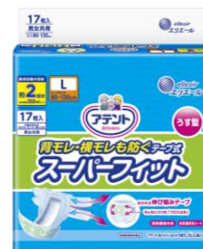
アテント 背モレ・横モレも防ぐ うす型スーパーフィットテープ式 L17 枚