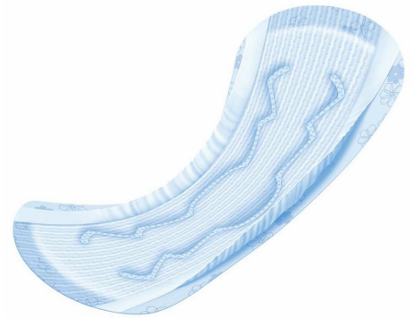
※ナチュラさら肌さらり 吸水ナプキン 長時間快適用 イメージ図

■商品名:『ナチュラ さら肌さらり』、『ナチュラ さら肌さらりコットン 100%』