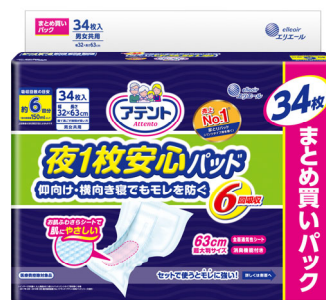
アテント 夜1枚安心パッド