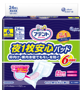
アテント 夜1枚安心パッド

大王製紙株式会社(住所：東京都千代田区)は、「アテント 夜1枚安心パッド 仰向け・横向き寝でもモレを防ぐ6回吸収」を肌へのやさしさそのままに、よりモレにくい品質へリニューアルし、2019年3月21日(木)より全国で発売します。