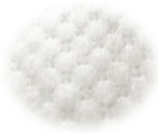
お肌ふわさらシート