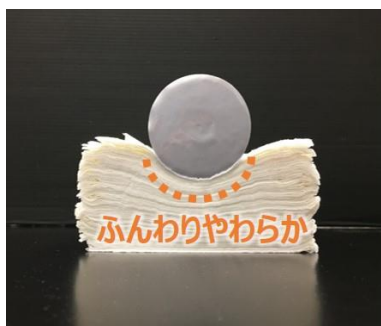
新・エリエールティシュー

ふんわりとした柔らかさは、ティシューの束に重りを載せてみると一目瞭然です。柔らかく肌を包みこみ、普段づかいできる肌にやさしい品質となっています。