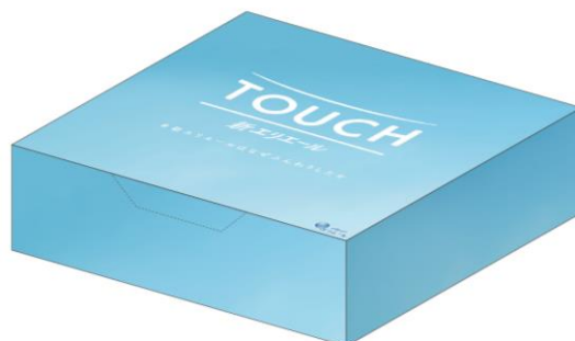
【ふんわり謎解きキット】(画像は開発中のものです)