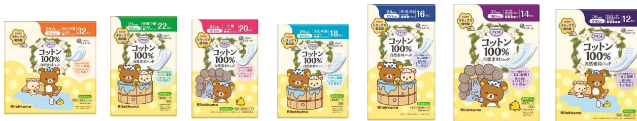
アテントコットン100%自然素材パッド 各種(通常パック)