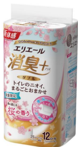
エリエール消臭+トイレットティシュー 春を感じる桜の香り

衛生用紙製品 No.1 ※2 ブランドの「エリエール」を展開する大王製紙株式会社（本社：東京都千代田区）は、『エリエール消臭+』『エリエールフラワープリント』の桜企画品を2021年12月21日（火）より、数量限定で全国発売します。