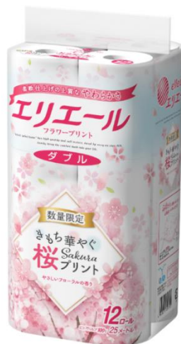
エリエールトイレットティシューフラワープリント 桜デザイン企画品