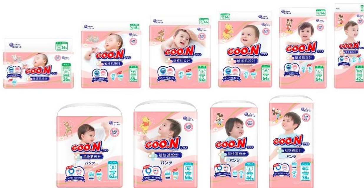
テープタイプ『グーンプラス 敏感肌設計』6種+パンツタイプ『グーンプラス 肌快適設計』4種

衛生用紙製品 No.1 ブランド※ 2 の「エリエール」を展開する大王製紙株式会社（本社：東京都千代田区）は、赤ちゃんの敏感肌を考え、肌への刺激を減らすことに着目したベビー用紙おむつ『グーンプラス』シリーズ（全 10 アイテム）の品質を改良し、商品パッケージをディズニーデザインに刷新して 2021 年 12 月 1 日（水）より全国で発売します。