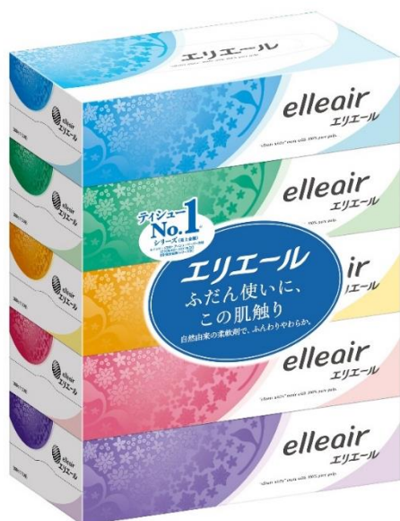
<エリエールティッシュ 180組 5箱>

衛生用紙製品No.1 ※1 ブランド「エリエール」を展開する大王製紙株式会社（住所：東京都千代田区）は、ティッシュのフラッグシップ商品である「エリエールティッシュ」についてさらに柔らかさをアップし、2021年10月1日（金）からリニューアル発売するとともに、新テレビCMの放映と柔らかさを体感できるキャンペーンを実施します。