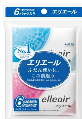
<エリエールティッシュポケット 10組 6個>

昨今ティッシュについてもより高品質な商品を求める方が増えています。当社の調査では、普段づかいするティッシュの柔らかさに不満を感じる方は35%に上ることが分かりました ※2 。お家時間を過ごす上で毎日使うティッシュだからこそ、より肌にやさしくストレスの少ない商品を求めるニーズにお応えし、さらにやさしく柔らかくなった「エリエールティッシュ」を発売します。