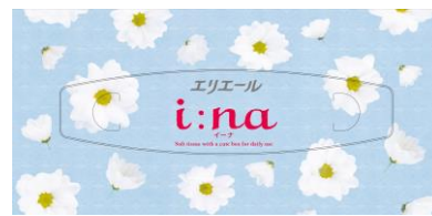
【参考】通常品の取り出し口