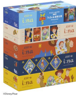
『エリエール i:na（イーナ）ティッシュ トイ・ストーリー限定デザイン フィルムレス』（150組5箱パック）

衛生用紙製品No.1ブランド ※1 の「エリエール」を展開する大王製紙株式会社（本社：東京都千代田区）は、7月3日（金）に劇場公開を控えたディズニー & ピクサー最新作『トイ・ストーリー5』のキャラクターをパッケージデザインに採用し、フィルムをなくした独自の取り出し口形状 ※2 の『エリエール i:na（イーナ）ティッシュ トイ・ストーリー限定デザイン フィルムレス』（1商品）を2026年6月1日（月）から全国（北海道を除く）で数量限定発売します。