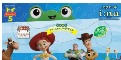
フィルムレスのボックスを上から見た様子