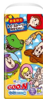
BIGより大きいサイズ