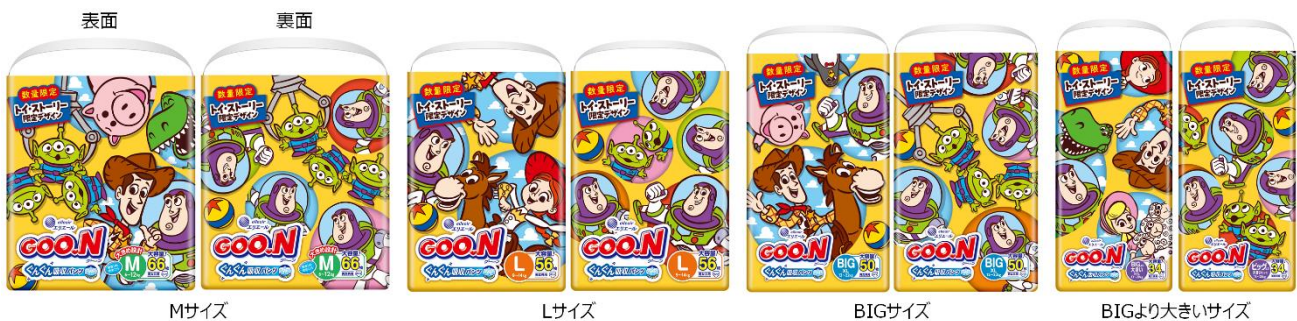
『グーン ぐんぐん吸収パンツ トイ・ストーリー限定デザイン』

衛生用紙製品 No.1 ブランド※ 1 の「エリエール」を展開する大王製紙株式会社（本社：東京都千代田区）は、今夏、続編映画の公開予定で話題となっている『トイ・ストーリー』シリーズのキャラクターがパッケージやおむつ柄に描かれたベビー用紙おむつ『グーン ぐんぐん吸収パンツ トイ・ストーリー限定デザイン』（全4商品）を2026年6月1日（月）から数量限定で全国発売します。