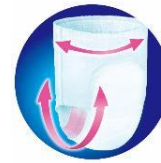
「ぴったりモレガード構造」イメージ

・「ぴったりモレガード構造」(Mサイズ・BIGより大きいサイズ) おなかまわりと足まわりのギャザーがフィットしてすきまモレをガード。 たくさん動いても、ズレずにモレ安心！