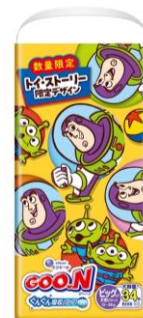
BIGより大きいサイズ