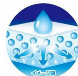
「スピード吸収体」イメージ