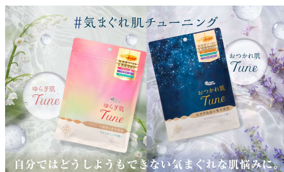
自分ではどうしてもできない気まぐれな肌悩みに。