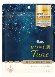
『エリエール ゆらぎ肌Tune シートマスク』 『エリエール おつかれ肌Tune シートマスク』