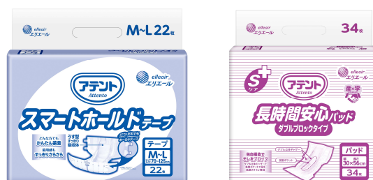
「アテント スマートホールドテープ」(左)