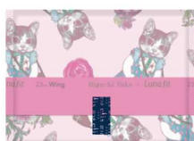
★23cm 羽つき 超スリムタイプ