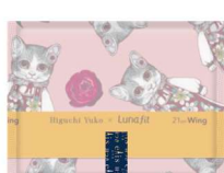
21cm 羽つき 超スリムタイプ