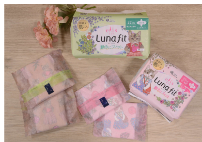
23cm 羽つき 超スリムタイプ 27cm 羽つき ふんわりタイプ