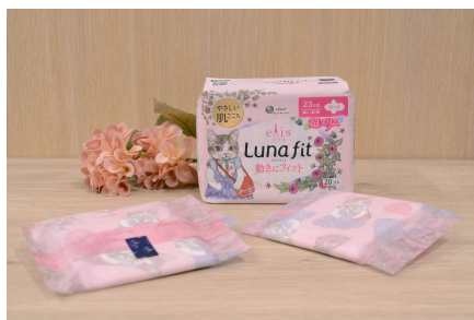
23cm 羽つき 超スリムタイプの外装パッケージと個包装