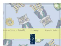
★27cm 羽つき 超スリムタイプ