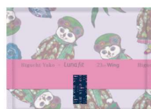
★23cm 羽つき ふんわりタイプ