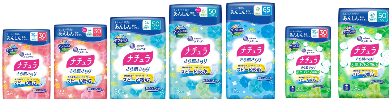
「ナチュラ さら肌さらり あんしん吸水ナプキン」(左から) 30cc/ロング 30cc/50cc/ロング 50cc/65cc

衛生用紙製品 No.1 ブランド ※2 の「エリエール」を展開する大王製紙株式会社（本社：東京都千代田区）は、初めて吸水ケア用品を手取る方でも、機能や吸収量の違いが分かりやすく、症状に応じた商品が選びやすいパッケージデザインと商品名にリニューアルした「ナチュラ さら肌さらり あんしん吸水ナプキン」シリーズ（全 7 種類）を 2025 年 9 月 19 日（金）から全国発売します。