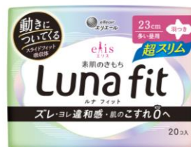
エリス 素肌のきもち ルナフィット 超スリムタイプ