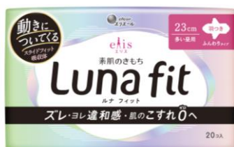
エリス 素肌のきもち ルナフィット ふんわりタイプ

衛生用紙製品 No.1 ブランド ※2 の「エリエール」を展開する大王製紙株式会社（本社：東京都千代田区）は、体の動きについてくる“スライドフィット吸収体”を採用し、ズレ・ヨレ違和感や肌への負担の低減を実現した新発想の生理用ナプキン『エリス 素肌のきもち ルナフィット』全16商品（ふんわりタイプ6商品／超スリムタイプ8商品／シンプルデザイン2商品）を2025年4月1日（火）から全国発売します。