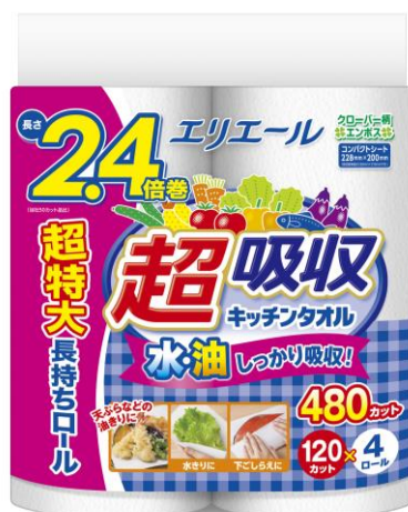
エリエール 超吸収キッチンタオル 4ロール（120カット） 2.4倍巻

衛生用紙製品 No.1 ブランド ※1 の「エリエール」を展開する大王製紙株式会社（本社：東京都千代田区）は、長く巻いても潰れにくい当社独自開発のエンボス（凹凸）加工で、油をキープしてしっかり吸収する『エリエール 超吸収キッチンタオル 4ロール（120カット） 2.4倍巻』を2023年4月21日（金）から北海道を除く全国で発売します。