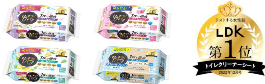
キレキラ！トイレクリーナー 1枚で徹底 おそうじシート（期間限定 LDK パッケージ）

衛生用紙製品 No.1 ブランド ※1 の「エリエール」を展開する大王製紙株式会社（本社：東京都千代田区）では、拭き掃除ブランド「キレキラ®！」シリーズの「キレキラ！トイレクリーナー 1枚で徹底 おそうじシート」がこのたび、テストする女性誌『LDK』（株式会社晋遊舎）2022年12月号において、トイレクリーナーシート部門ベストバイを受賞しました。受賞ロゴマークをデザインした限定パッケージを2023年4月から順次出荷開始します。