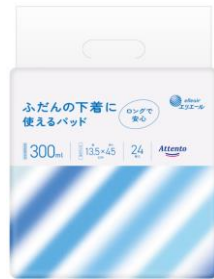
アテント ふだんの下着に使えるパッド

衛生用紙製品 No.1 ブランド ※1 の「エリエール」を展開する大王製紙株式会社（本社：東京都千代田区）は、安心の300ml吸収量とシンプルなパッケージデザインを採用した下着用の尿とりパッド『アテント ふだんの下着に使えるパッド』を2023年4月21日（金）から全国で発売します。