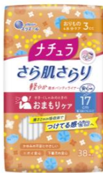
ナチュラ さら肌さらり 軽やか吸水パンティライナー 17cm3cc

衛生用紙製品 No.1 ブランド ※1 の「エリエール」を展開する大王製紙株式会社（本社：東京都千代田区）は、吸水ケアブランド「ナチュラ」から、安心感のある長さで初めての方でも使いやすい「さら肌さらり 軽やか吸水パンティライナー」シリーズ2種（17cm3cc／コットン100% ※2 17cm3cc）および「さら肌さらり よれスッキリ」シリーズの吸水パッド2種（24cm30cc／26cm50cc）を2023年4月21日（金）から全国発売します。