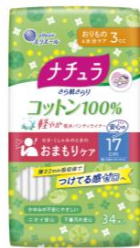
ナチュラ さら肌さらり コットン100% 軽やか吸水パンティライナー 17cm3cc