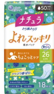
ナチュラ さら肌さらり よれスッキリ吸水パッド 26cm50cc