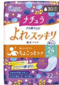
ナチュラ さら肌さらり よれスッキリ吸水パッド 24cm30cc