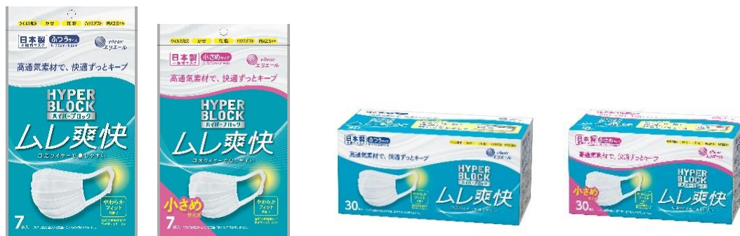
7枚入（ふつう/小さめサイズ）

衛生用紙製品 No.1 ブランド ※1 「エリエール」を展開する大王製紙株式会社（本社：東京都千代田区）は、マスク装着時のムレを軽減する高機能不織布マスク『ハイパーブロックマスク ムレ爽快』の耳掛け素材のやわらかさをアップするとともに、パッケージも刷新し、2023年4月1日（土）から全国でリニューアル発売します。