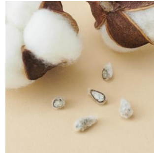
コットンリントー