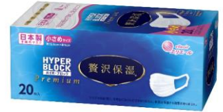
（ふつう／小さめサイズ）

【公式 HP】 https://www.elleair.jp/product/detail/mask_zeitaku