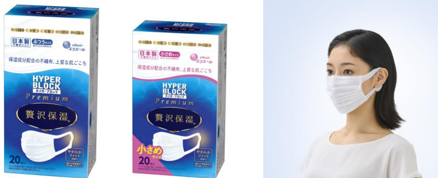
エリエール ハイパーブロックマスク 贅沢保湿 20枚入 （ふつう/小さめサイズ）

衛生用紙製品 No.1 ブランド ※2 の「エリエール」を展開する大王製紙株式会社（本社：東京都千代田区）は、マスク用の保湿成分を肌にあたる内側不織布に塗布し、上質な肌ごちを実現した日本製不織布マスク『ハイパーブロックマスク 贅沢保湿』に大容量タイプ 20枚入（ふつう/小さめ）を追加して2023年1月20日（金）から全国発売します。