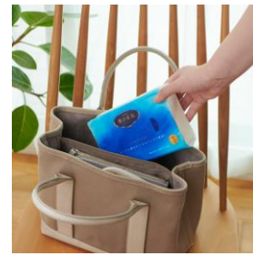
エリエール 贅沢保湿ソフトパックティッシュ／130組3個パック