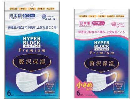
（ふつう／小さめサイズ）

【公式HP】 https://www.elleair.jp/product/detail/mask_zeitaku