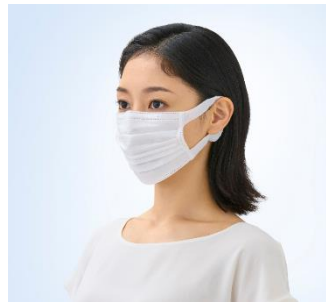
エリエール ハイパーブロックマスク 贅沢保湿（ふつろ／小さめサイズ）