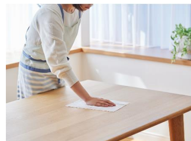
※拭き取りイメージ