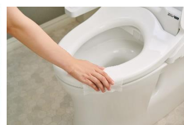
※拭き取りイメージ