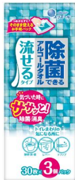
除菌できるアルコールタオル 流せるタイプ

衛生用紙製品 No.1 ブランド ※2 の「エリエール」を展開する大王製紙株式会社（本社：東京都千代田区）は、ウエットティッシュ「除菌できるシリーズ」から『除菌できるアルコールタオル 流せるタイプ』と『除菌できるアルコールタオル 食卓テーブル用 EX』を新発売。これまでの『除菌できるウエットタオル 食卓テーブル用』はパッケージをリニューアルし、いずれも 2022 年 10 月 1 日（土）から全国で発売します。