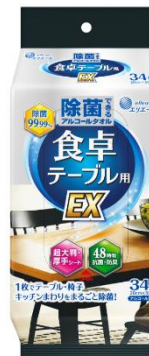
除菌できるアルコールタオル 食卓テーブル用 EX