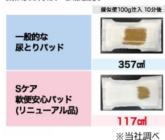
擬似便吸収後の拡散面積

独自の3層構造（表面シート・ろ過シート・吸収体）を採用し、網目状の表面シートで目詰まりを起こさずに3層目まで軟便（尿・便）を吸収。一般的な尿とりパッドに比べて便の拡散面積を約1/3におさえることで肌への付着面積を減らして肌刺激を低減。スキントラブル発生リスク軽減や便モレ低減を目指します。