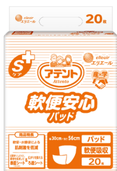
アテント S ケア 軟便安心パッド 業務用

衛生用紙製品 No.1 ブランド ※2 の「エリエール」を展開する大王製紙株式会社（本社：東京都千代田区）は、真田弘美先生（石川県立看護大学 学長/前東京大学老年看護学 教授）と仲上豪二郎先生（東京大学大学院 医学系研究科 老年看護学/創傷看護学分野 教授）との共同研究成果をもとに開発された、軟便・水様便の吸収にすぐれた「アテント S ケア 軟便安心パッド」を 17 年ぶりにリニューアルして 2022 年 9 月 12 日（月）から全国の病院・介護施設等向けに販売します。