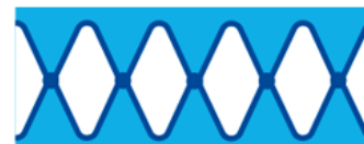
スーパーWエンボス加工 イメージ図