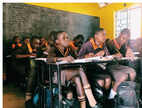
マゴソスクールで勉強する様子