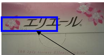
エリエールティッシュ180W